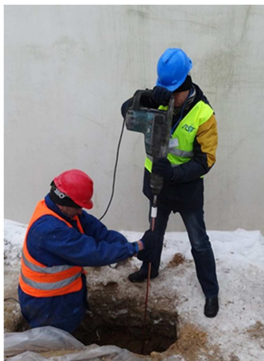
Rys. 3. Pogrążanie uziomu pionowego w ziemi za pomocą wibromłotu

Zarówno w normach elektrycznych (PN-HD 60364-5-54), jak i odgromowych (PN-EN 62305-3) znajdują się zapisy mówiące o niebezpieczeństwie jakie może wynikać ze stosowania niewłaściwych materiałów w przypadku łączenia sztucznej instalacji uziemiającej z uziomem fundamentowym. Łączenie popularnych (ze względu na niską cenę) bednarek ze stali ocynkowanej ze stalą zalaną w